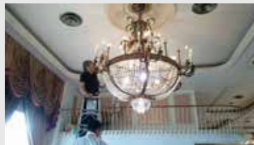
シャンデリア交換前