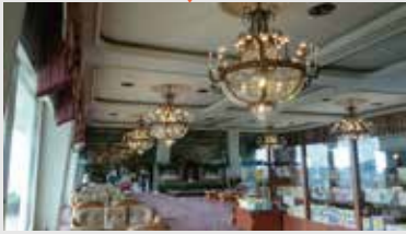
シャンデリア交換後