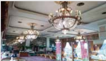
シャンデリア交換前