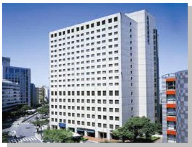
大阪 ホテルコムズ大阪 様